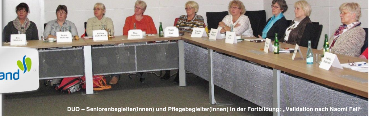
DUO – Seniorenbegleiter(innen) und Pflegebegleiter(innen) in der Fortbildung: „Validation nach Naomi Feil“