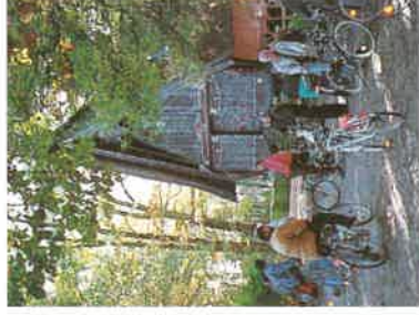
▶ Batak-Haus in Werpeloh