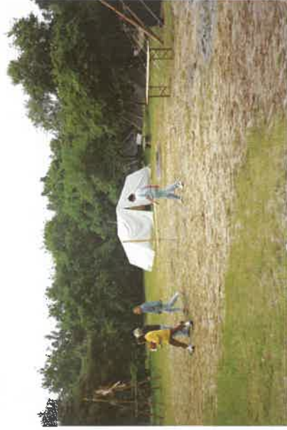
Spiel- und Bolzplatz

An den Gemeinschaftsraum schließt sich eine große überdachte Freiterrasse, deren Kernstück ein offener Kamin ist, an. Das Küchen- und Begleitpersonal kann z. T. in zwei rustikalen Blockhäusern untergebracht werden.