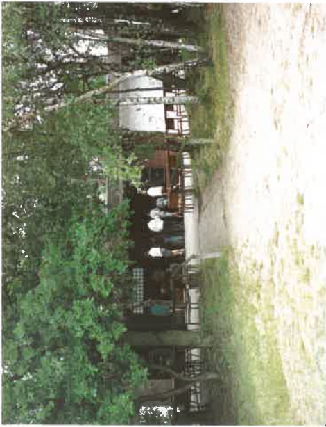
Freiterrasse mit offenem Kamin