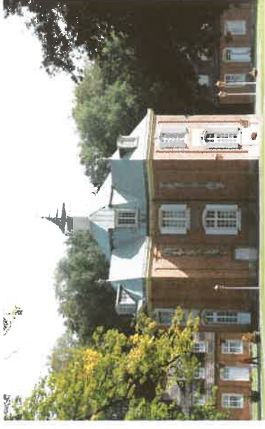
▶ Schloß Clemenswerth in Sögel