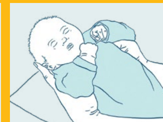
بلند کردن نوزاد